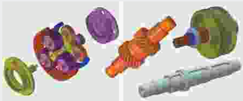
↓ Рис. 4. Примеры деталей, построенных с помощью приложения КОМПАС-Shaft 3D в системе КОМПАС-3D

Проектирование на основании 3D-моделирования в КОМПАС-3D, кроме значительного повышения эффективности работы самих конструкторов, несет в себе целый ряд других преимуществ.