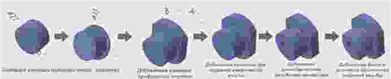
↑ Рис. 5. Последовательность построения модели втулки инструментами приложения КОМПАС-Shaft 3D

Сборочная модель, построенная в строгом соответствии со структурой будущего изделия, может служить источником автоматического заполнения электронной структуры изделия в системе класса PLM (например ЛОЦМАН: PLM).