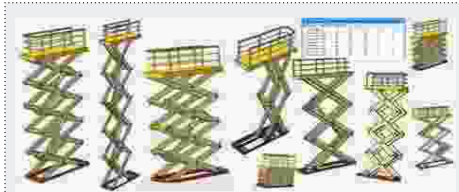
↑ Рис. 1. Различные модификации ножничного подъемника, полученные на основе одной полностью параметризованной сборочной модели

Использование функциональных возможностей наложения параметрических взаимосвязей на геометрические примитивы эскиза, а также задание аналитических зависимостей между взаимосвязанными размерами модели повышает эффективность проектирования. Особенно это заметно при неизбежном редактировании деталей в процессе их разработки, а также в случае необходимости создания деталей и сборочных единиц различных исполнений или модификации существующих деталей и узлов. Эффективность работы в САПР зависит как от рационального использования базового инструментария системы при проектировании, так и от уровня ее наполненности различными приложениями, прикладными библиотеками. Подобного рода библиотеки направлены на автоматическую генерацию программой типовых конструктивных элементов деталей, в некоторых случаях на основе выполненных расчетов. А также это библиотеки различных стандартных и покупных изделий, использование которых ускоряет создание сборочных моделей.